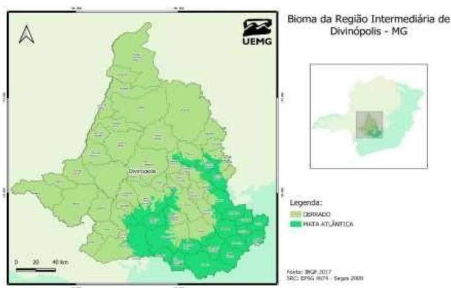
Figura 3. Biomas da Região Intermediária de Divinópolis, segundo o IBGE (2017)

A região está localizada em um ponto privilegiado do estado de Minas Gerais, pois, além de estar entre as principais represas do estado, Lago de Furnas e Represa de Três Marias, tendo como pontais as cidades de Formiga e Martinho Campos respectivamente, localiza-se em sua circunscrição a Serra da Canastra, no município de São Roque de Minas, onde tem a nascente histórica do Rio São Francisco, onde sua nascente geográfica também está na região, em Medeiros. Está inserida nos Biomas de Mata Atlântica e Cerrada. Sua vegetação é composta por Formações Pioneiras, Savanas, Vegetação de Contato e Florestas Estacionais Decidual e Semidecidual. Os Biomas e a Vegetação presente na Região Intermediária de Divinópolis são representados pela Figura 2 e pela Figura 3, respectivamente.