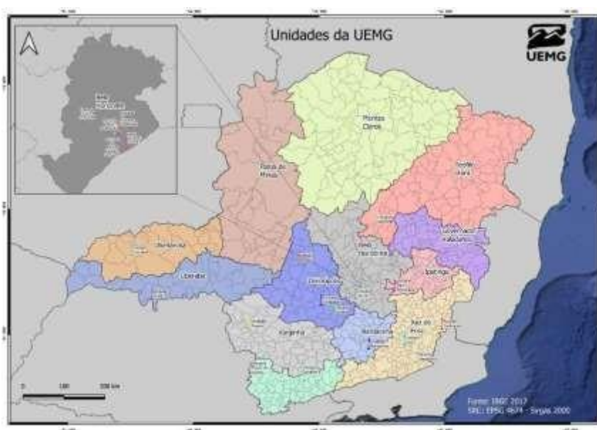
Figura 1: Distribuição das Unidades da UEMG segundo regiões Intermediárias de Minas Gerais

Por meio da Lei nº 20.807, de 26 de julho de 2013, foi prevista a estadualização das fundações educacionais de ensino superior associada à UEMG, de que trata o inciso I do § 2º do art. 129 do ADCT, a saber: Fundação Educacional de Carangola; Fundação Educacional do Vale do Jequitinhonha, de Diamantina; Fundação de Ensino Superior de Passos; Fundação Educacional de Ituiutaba; Fundação Cultural Campanha da Princesa, de Campanha e Fundação Educacional de Divinópolis; bem como os cursos de ensino superior mantidos pela Fundação Helena Antipoff, de Ibirité, estruturada nos termos do art. 100 da Lei Delegada nº 180, de 20 de janeiro de 2011, cujos processos de estadualização foram encerrados em novembro de 2014. A Figura 1 demonstra a localização das Unidades da UEMG no estado de Minas Gerais, nas regiões intermediárias do estado.