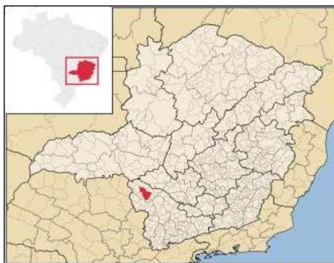
FIGURA 2 - Mapa de Minas Gerais e suas Regiões em vermelho Passos cede da UEMG e a Região de Abrangência

Além de cursos de graduação, a instituição oferta pós-graduação com vários cursos na modalidade lato sensu, além do Mestrado Profissional em Desenvolvimento Regional e Meio Ambiente aprovado pela CAPES. Abaixo, na Figura 2, segue mapa da Região do Sudoeste Mineiro destacando o município de Passos e a região de abrangência no entorno e demais regiões divididas do estado.